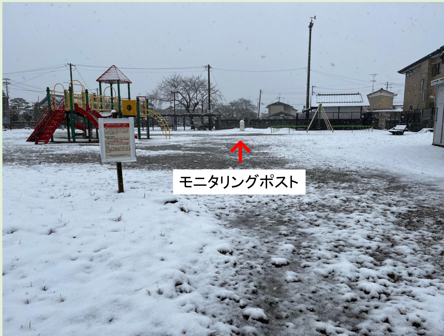
モニタリングポスト